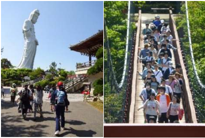
初夏のハイキング(5月)