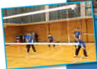
KCスポーツクラスマッチ