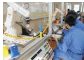
産業用ロボット実習