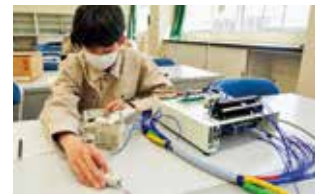
シーケンス制御実習