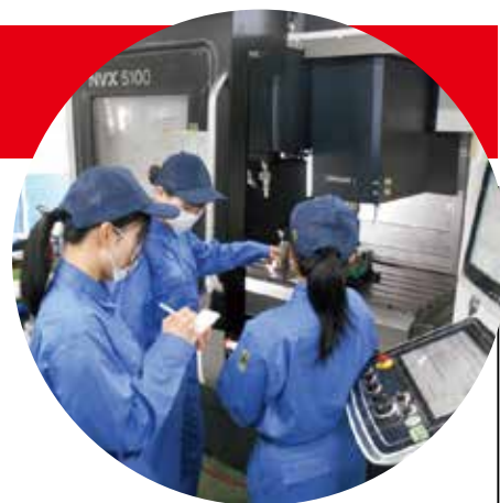
マシニングセンタ実習