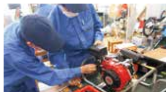
エンジン分解実習

全国有数の設備の中で、「ものづくり」の基礎から応用まで、幅広い知識と技能を学ぶことができます。資格取得など、自分の将来の夢に向かって頑張る生徒を全力で応援します。