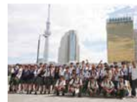
隅田川に架かる橋梁群見学