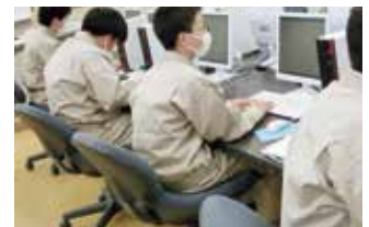
コンピュータ実習