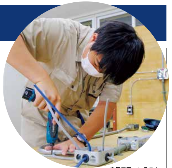
電気工事コンテスト