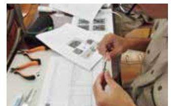
マイクロロボット講習会