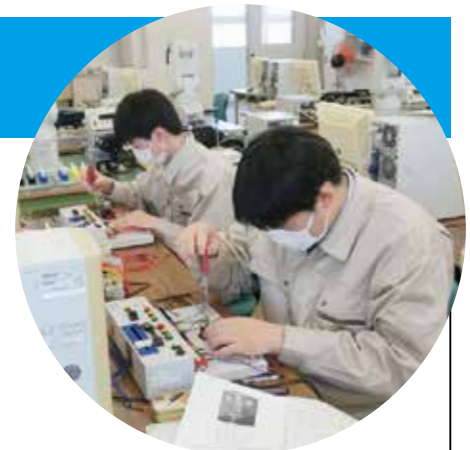
シーケンス制御装置