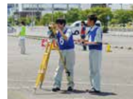
高校生ものづくりコンテスト測量部門