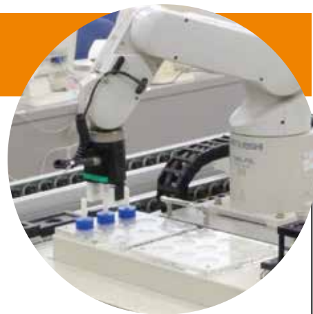
ロボット制御実習