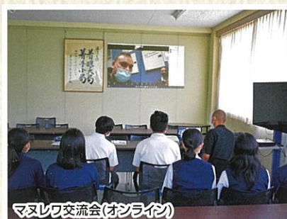
マヌレワ交流会(オンライン)