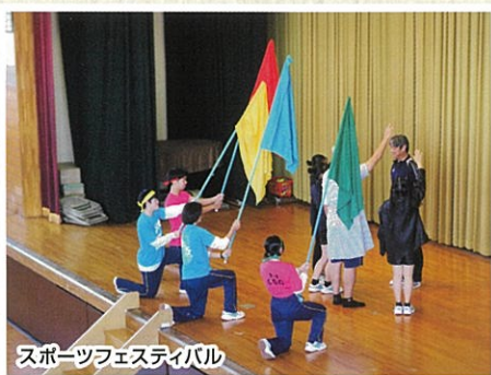
スポーツフェスティバル