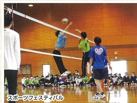
スポーツフェスティバル