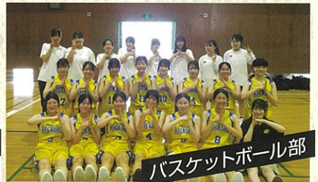
バスケットボール部