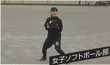
女子ソフトボール部