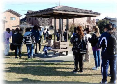
ウォークラリー（11月）