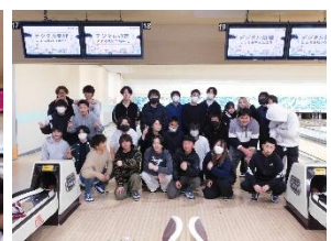
校内親善競技大会