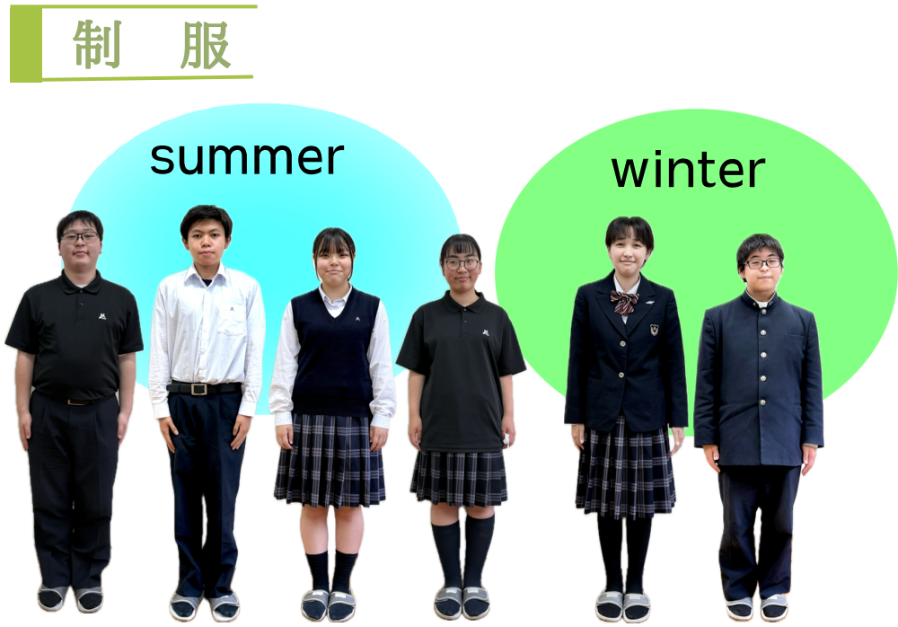
夏服は、半袖Yシャツもあります。女子にはパンツスタイルもあります。