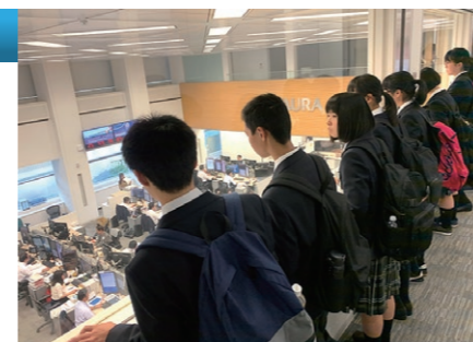
野村ホールディングス

都内の一流企業や官公庁を訪問し、仕事を通して生活や社会をより豊かにすることをめざす職場の実態を学びます。この活動を通して働くことと学ぶことの関連に気づき、自分自身の将来の進路について考えるきっかけとします。