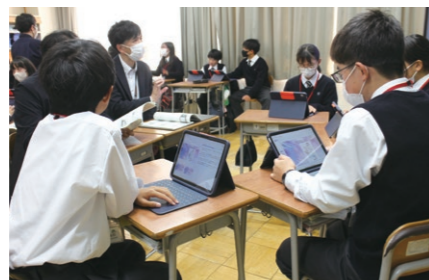
市役所の方々への政策提案

探究の方法を学ぶため、まずは身近な伊勢崎市の諸課題についてグループで調査を行います。市役所の方々から直接お話をうかがったり、大学の先生の講義を受けたりしながら、探究のスキルを身に付け、まとめとして伊勢崎市に政策提案を行います。