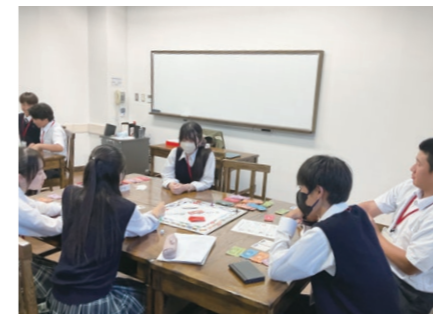
グローバルスタディーズキャンプ(GSC 4年) プリティッシュヒルズ

各分野で活躍されている専門家に講義をしていただいたり、外国人の方との交流を行ったりしながら、グローバルな視点で様々な課題を捉え、その解決策を考えます。