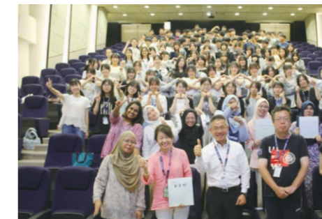
ウーロンゴン大学 マレーシア校

1年生から積み重ねてきたグローバル学習の集大成となる研修です。体験活動や専門家による講義を通して、グローバル社会で活躍していくための資質を養います。