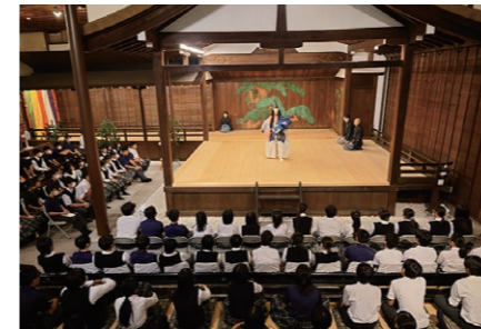
能と狂言 大江能楽堂