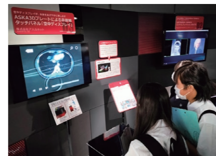
ナノ医療イノベーションセンター

それぞれの探究テーマを探るべく、都内の国際機関や企業、大学を中心に1泊2日で最先端の知識や本物の技術に触れ、更なる探究心を育みます。期間中、その分野のエキスパートの方々から特別講義を受けます。