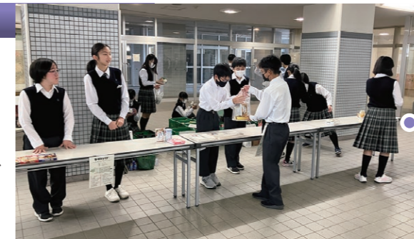
フードドライブ 本校エントランスホール

本校の6年間を貫く総合的な学習や探究活動の柱にSDGs学習があります。専門家の講義や様々な体験学習を通して教養を身につけ、自ら興味を持った分野について探究します。