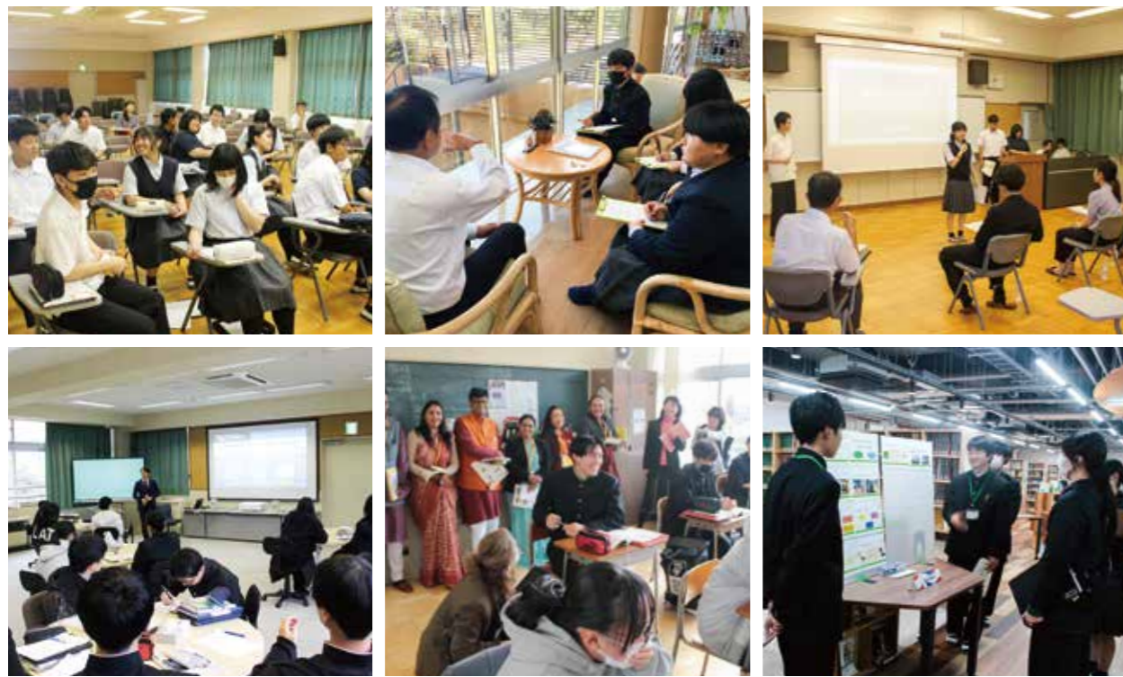
2年次よりコース選択