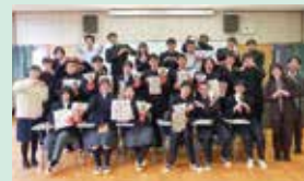
利用生徒一同(令和7年度)

費用 月額50,000円程度(土日を含む食事3食)、その他冬季は暖房費などが別途かかります。