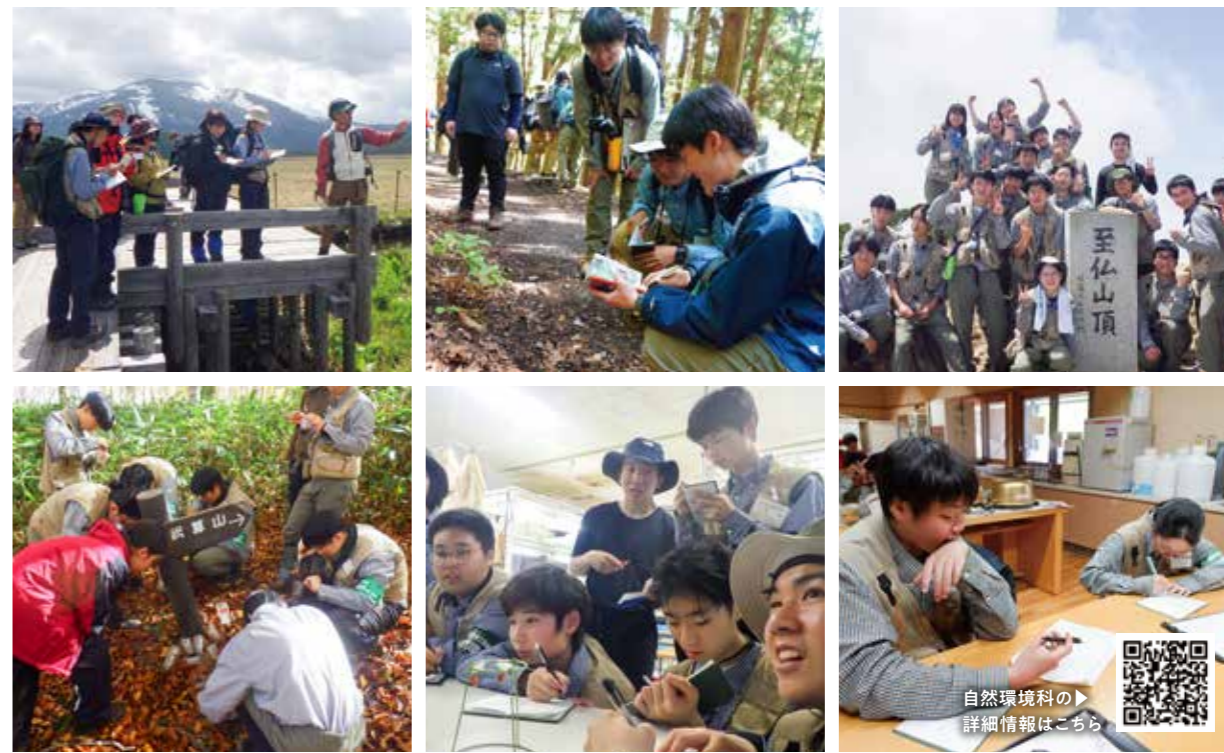
2年次よりコース選択