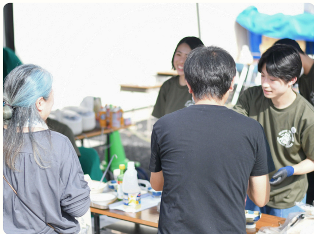
・ Believe Tsumagoi(社会参画プロジェクト)