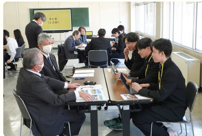
・ 婦恋村議会議員との意見交換会