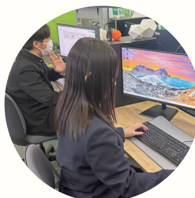
7 プログラミング部