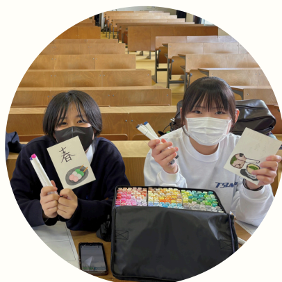
6 文化芸術部 (イラスト研究班/吹奏楽班)