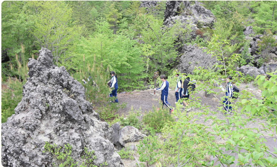
・浅間山北麓ジオパーク連携