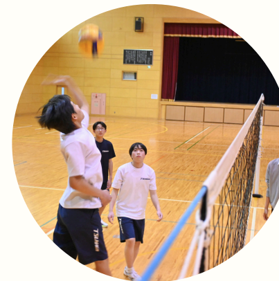
4 軽スポーツ部 R8 New!