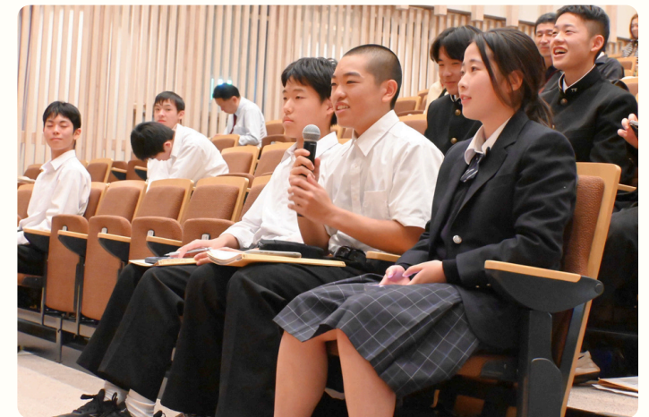
・ 理数探究基礎発表会