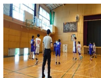
試合中の様子（バスケットボール部）