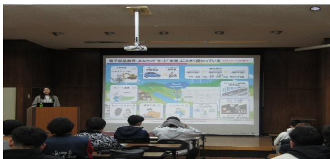
進路講演会の様子

機械・電気等の基礎技術を総合的に学び、将来の技術革新にも対応できる技術者の育成を目指しています。また進路講演会等も実施し、卒業後の進路を考える機会も用意しています。