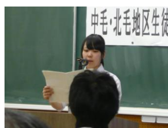
中北毛地区生徒生活体験発表大会の様子