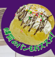
職員のパフェがスゴイ!