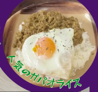
人気のガパオライス