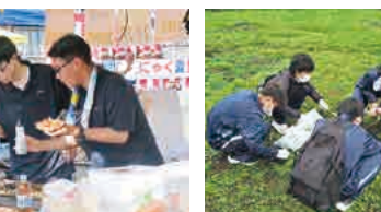
富岡製糸場清掃活動