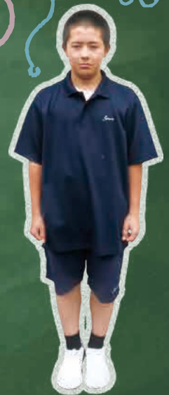
夏期ポロシャツ、ハーフパンツ