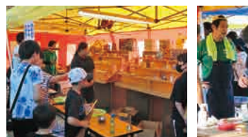
こんにゃく夏祭り