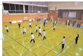
下高フェスティバル