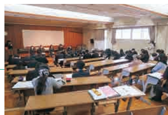
進路体験を聞く会