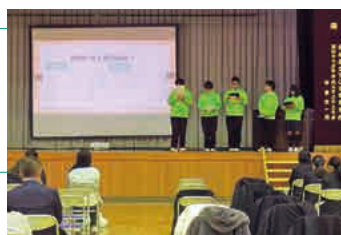
生徒研究活動発表会