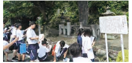
下仁田町発見ウォーク