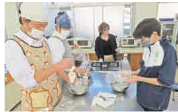
こんにゃく作り体験