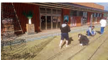
道の駅イルミネーション設置