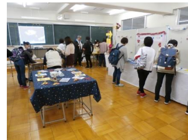
文化発表会通信制展示室(11月)