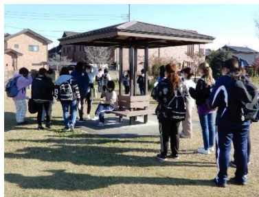
ウォークラリー(11月)