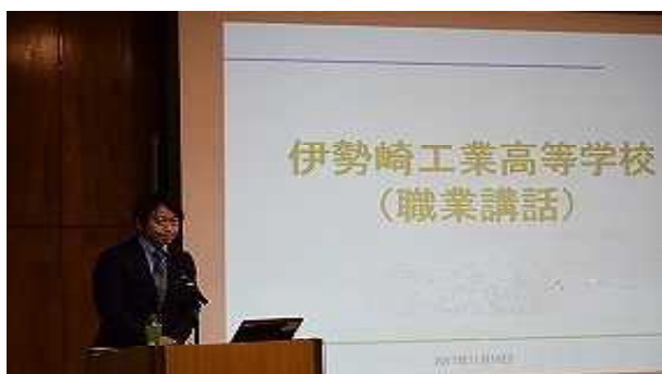
進路講演会の様子

機械・電気等の基礎技術を総合的に学び、将来の技術革新にも対応できる技術者の育成を目指しています。また進路講演会等も実施し、卒業後の進路を考える機会も用意しています。