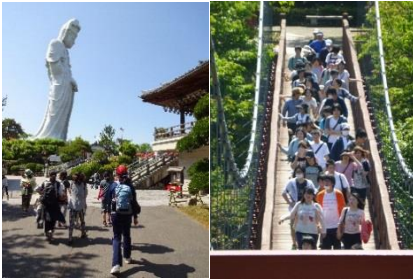
初夏のハイキング(5月)

※令和4年度は、コロナウイルス感染拡大のため、初夏のハイキングと文化祭の内容を変更しました。