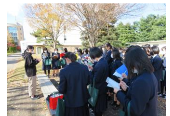
1年大学見学旅行：信州大学