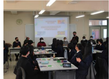
エンパワーメントプログラム