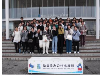
東北・北海道修学旅行