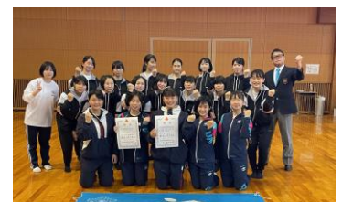
関東大会出場を決めた空手道部