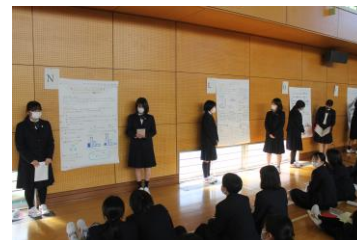
探究発表会の様子

また、渋女には特色のある行事がたくさんあります。開校記念行事である全校榛名登山をはじめ、清苑祭(文化祭・隔年実施)や体育大会、沖縄修学旅行など、どの行事にも生徒が生き生きと取り組んでいます。