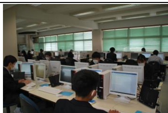
資格取得（ビジネス文書）