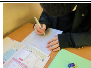
進路活動（礼状書き）