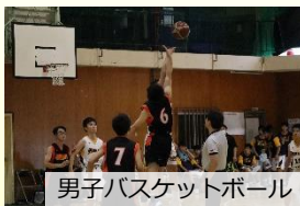
男子バスケットボール