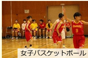
女子バスケットボール