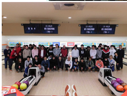
校内親善競技大会