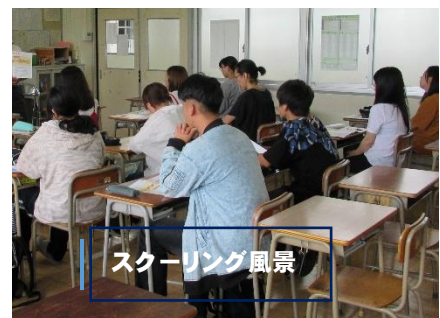
スクーリング風景