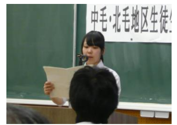
中北毛地区生徒生活体験発表大会の様子