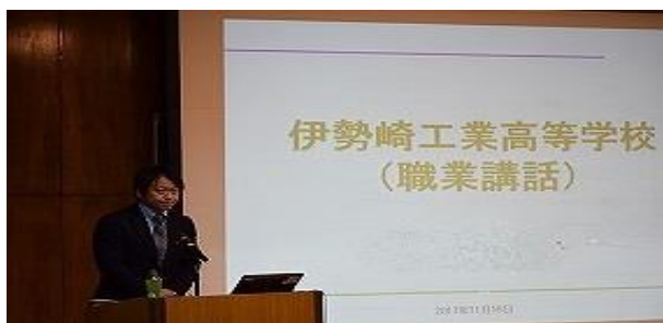
進路講演会の様子

機械・電気等の基礎技術を総合的に学び、将来の技術革新にも対応できる技術者の育成を目指しています。また進路講演会等も実施し、卒業後の進路を考える機会も用意しています。