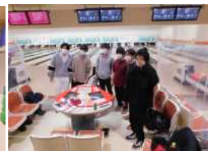
校内親善競技大会