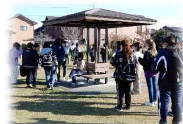
ウォークラリー(11月)