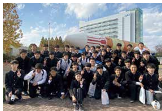
科学リテラシー研修