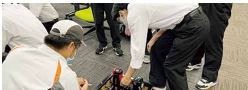
先輩、教えてください