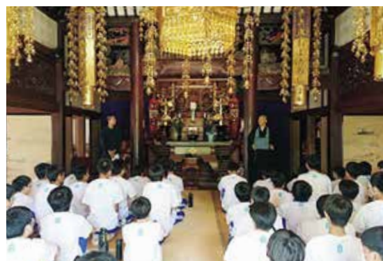
高高のルーツ探索