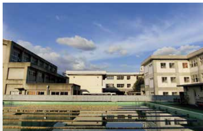
プールから見た第2体育館 理科棟