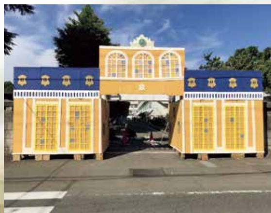
翠巒祭（正門アーチ）