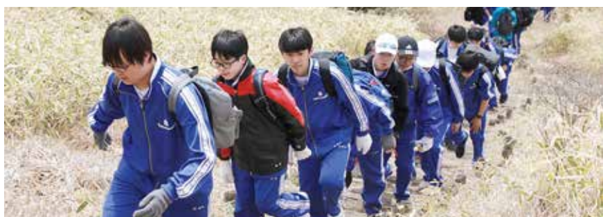
赤城オリエンテーション合宿