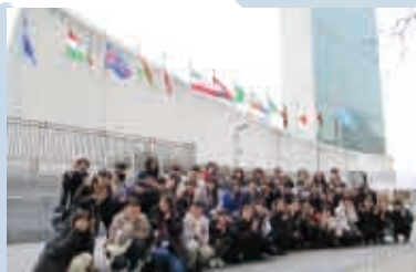
高女グローバル研修 in USA