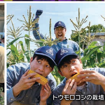
トウモロコシの栽培