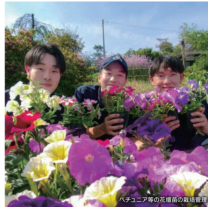
ペチュニア等の花壇苗の栽培管理

産業社会と人間/農業と環境/農業と情報 課題研究/総合実習 作物/野菜/畜産/草花/農業経営