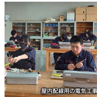
屋内配線の電気工事