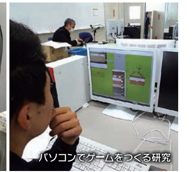
パソコンでゲームをつくる研究