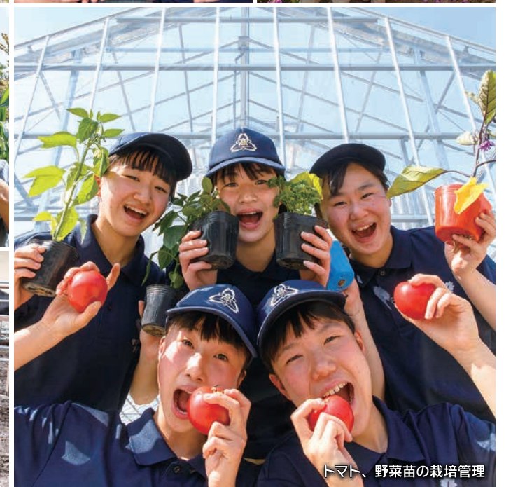
トマト、野菜苗の栽培管理