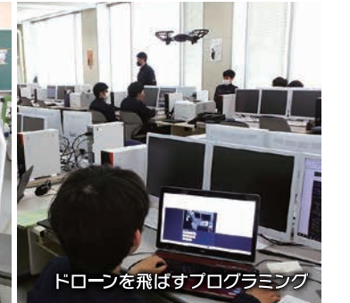
ドローンを飛ばすプログラミング