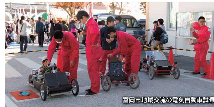
富岡市地域交流の電気自動車試乗