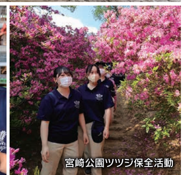
宮崎公園ツツジ保全活動