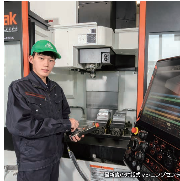
最新鋭の対話式マシニングセンター

産業社会と人間 / 工業技術基礎 / 課題研究 実習 / 製図 / 機械工作 / 機械設計 / 電気回路 工業材料技術 / 原動機 / ハードウェア技術 コンピュータシステム技術 / プログラミング技術