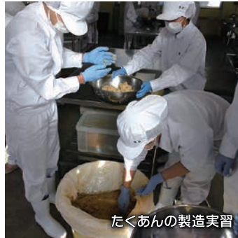
たくあんの製造実習