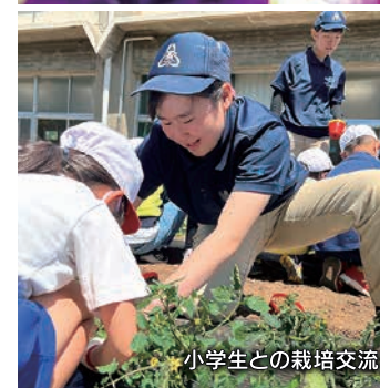
小学生との栽培交流