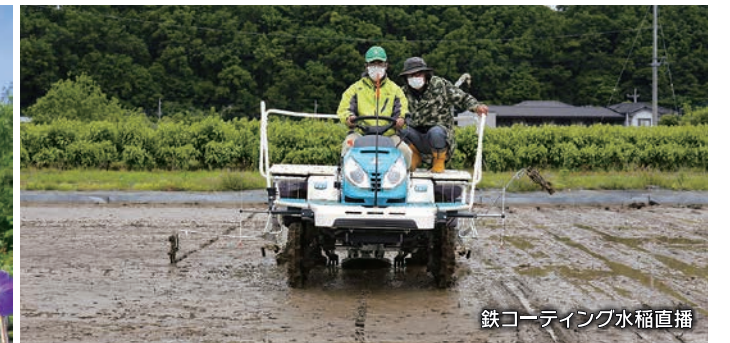
鉄コーティング水稲直播