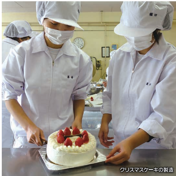
クリスマスケーキの製造

産業社会と人間 / 農業と環境 / 農業と情報 課題研究 / 総合実習 / 食品製造 / 食品化学 食品微生物 / 生物活用 / 食品開発 フラワーデザイン