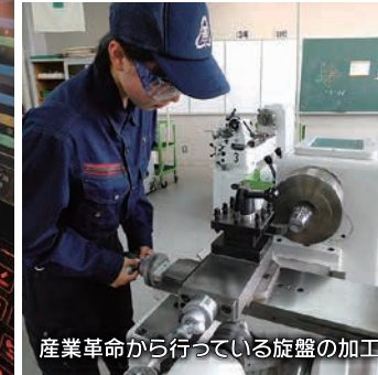
産業革命から行っている旋盤の加工