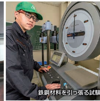
鉄鋼材料を引っ張る試験