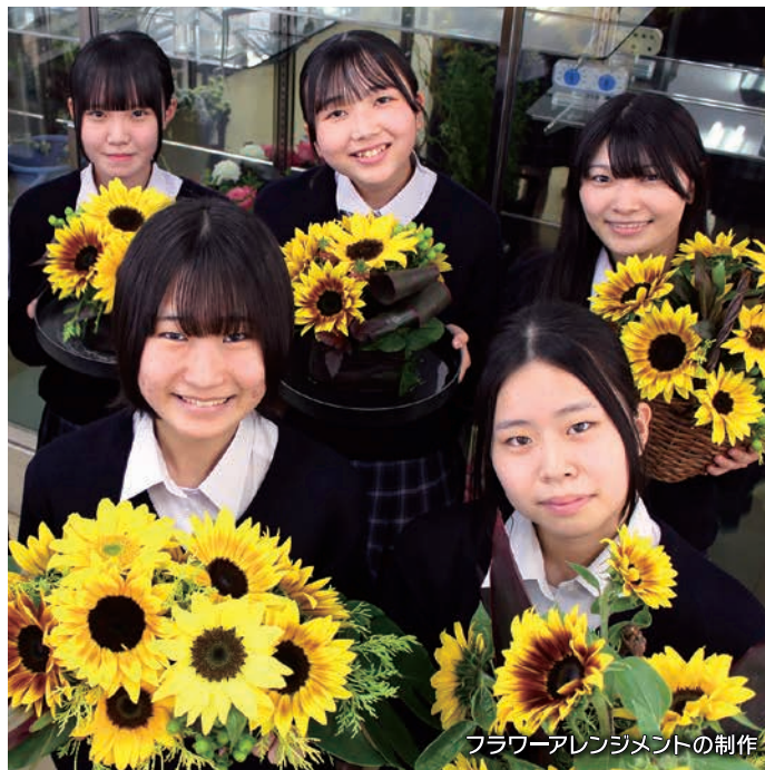
フラワーアレンジメントの制作