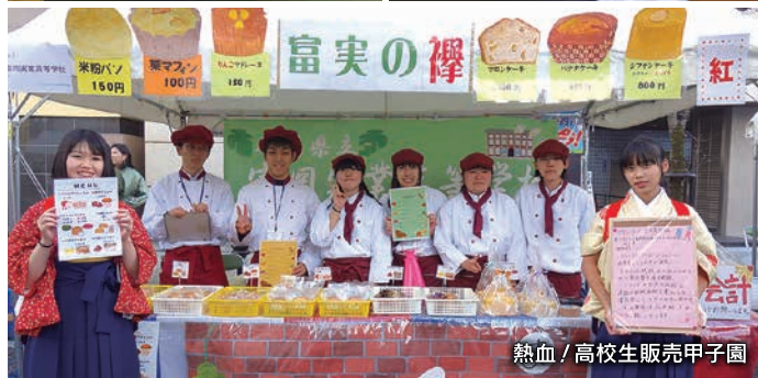
熱血！高校生販売甲子園