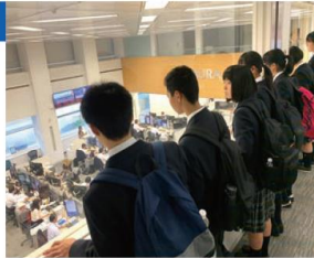
野村ホールディングス

都内の一流企業や官公庁を訪問し、働く場としての企業や公衆に奉仕する仕事の実態を学びます。この活動を通して、生徒自らが働くことと学ぶことの関連に気づき、自分自身の将来の進路について考えるきっかけとします。