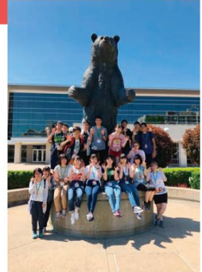
ミズーリ州立大学