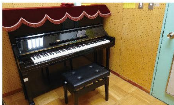
練習室（9部屋） 各室アップライトピアノ1台設置