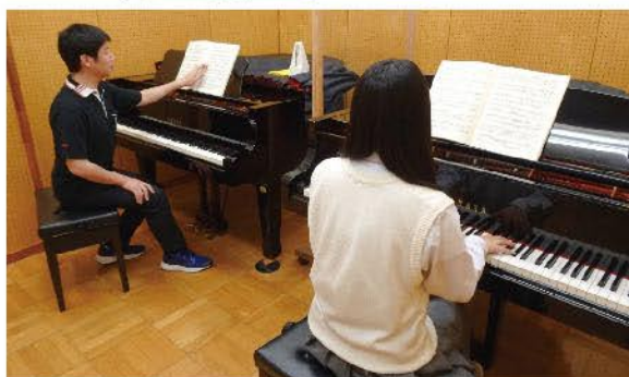
レッスン室（5部屋） 各室グランドピアノ2台設置