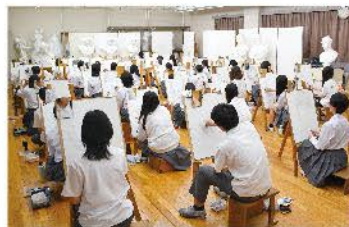
デッサンコンクール（全学年）