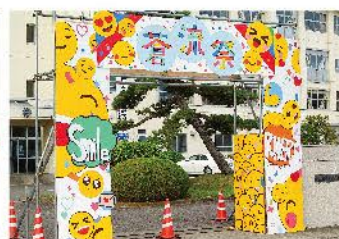
球技大会・体育祭・蒼流祭（文化祭）