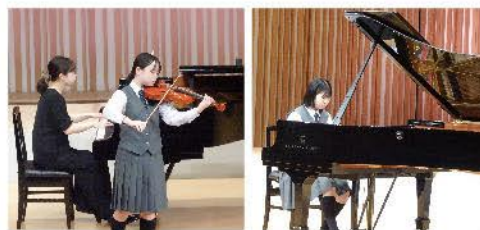
音楽コース演奏会