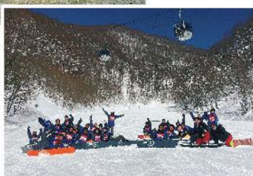
スキー スノーボード 実習