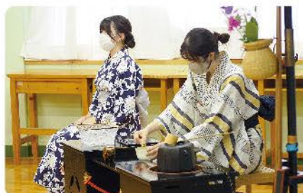
伝統三道部（華道・茶道・書道）