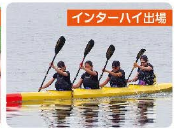
インターハイ出場