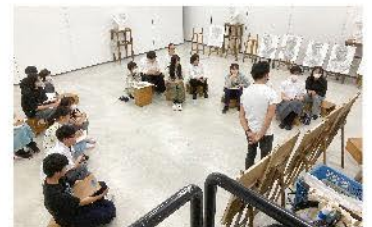
校外デッサン講習会（1年生）