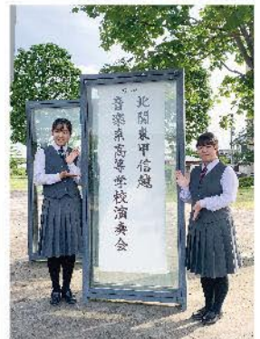
北関東甲信越 音楽系高等学校演奏会