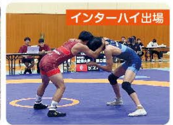
インターハイ出場