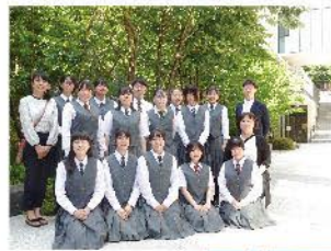
大学見学会 (東京音楽大学)