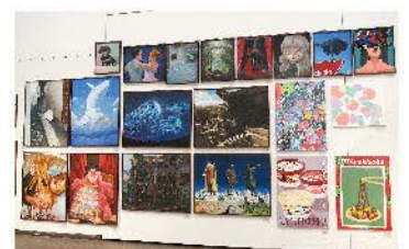
群馬県総合文化祭美術・工芸部門展