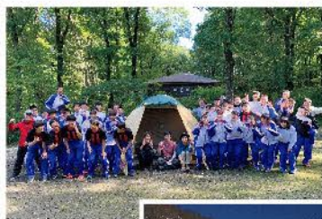
野外実習 (キャンプ実習)